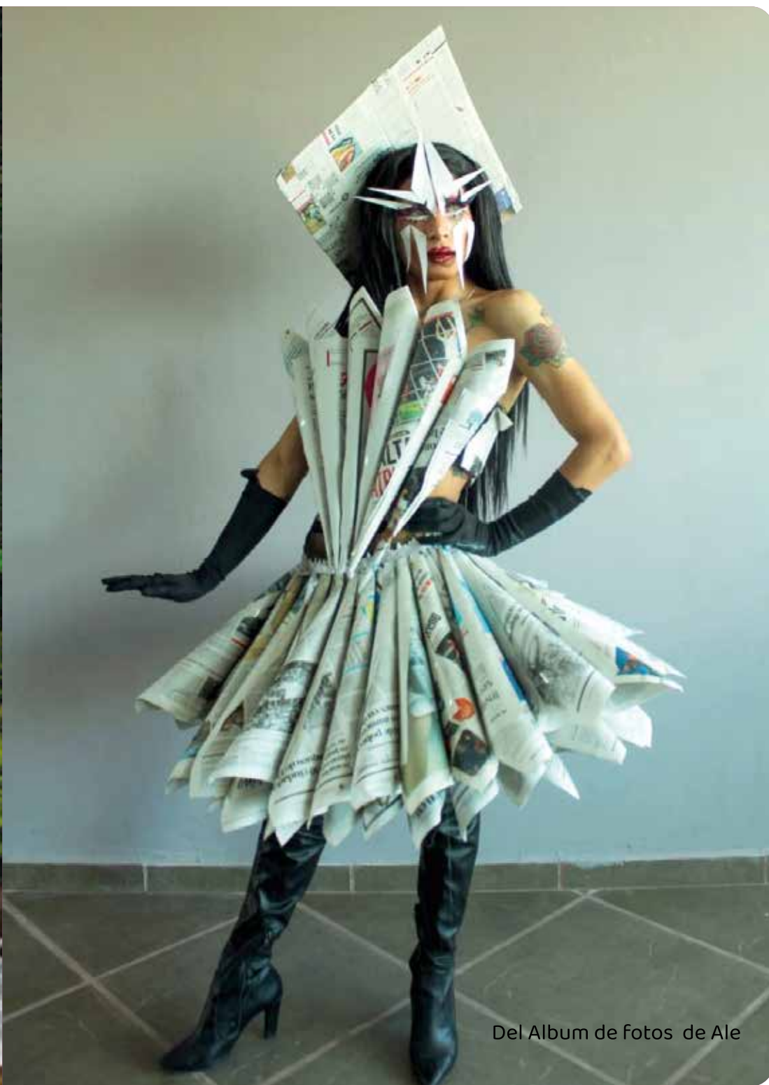
Del Album de fotos de Ale